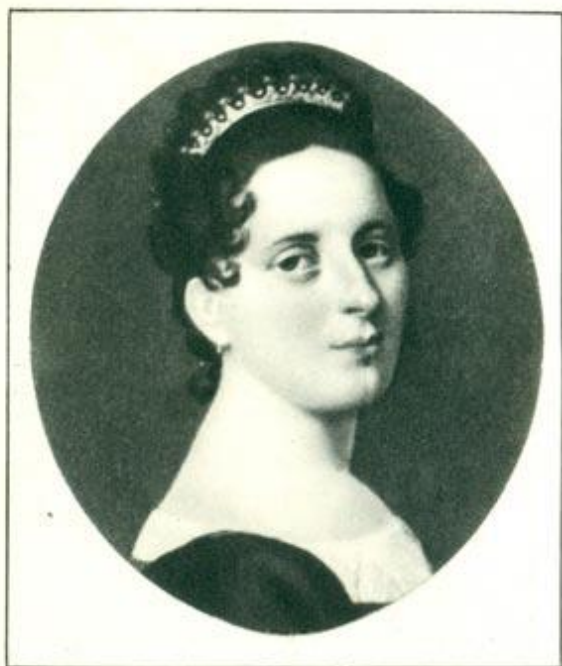
АЛЕКСАНДРА МИХАЙЛОВНА КОЛОСОВА (1802—1880 гг.)

О ты, надежда нашей сцены! Уж всюду торжества готовятся твои, На пышных играх Мельпомены, У тихих алтарей любви. «Отрывок». 1818 г.