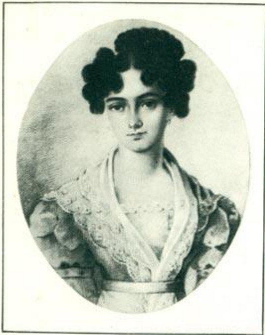
МАРИЯ НИКОЛАЕВНА РАЕВСКАЯ (1805—1865)

Тебе — но голос музы темной Коснется ль уха твоего? Поймешь ли ты душою скромной Стремленье сердца моего? Иль посвящение поэта, Как некогда его любовь, Перед тобою без ответа Пройдет, непризнанное вновь? Узнай, по крайней мере, звуки. Бывало, милье тебе, И думай, что во дни разлуки, В моей изменчивой судьбе Твоя печальная пустыня, Последний звук твоих речей — Одно сокровище, святыня, Одна любовь души моей. «Полтава». Посвящение. 1828 г.