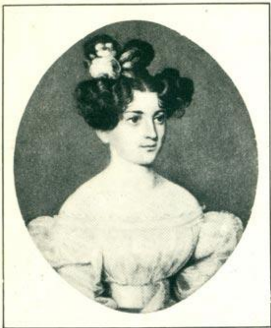
АЛЕКСАНДРА ОСИПОВНА РОССЕТ-СМИРНОВА (1809—1882)

В тревоге пестрой и бесплодной Большого сердца и двора Я сохранила взгляд холодный, Простое сердце, ум свободный И правды пламень благородный, И как дитя была добра: Смеялась над толпою вздорной, Судила здраво и светло, И шутки злости самой черной Писала прямо набело. «В альбом А. О. Смирновой». 1832 г.