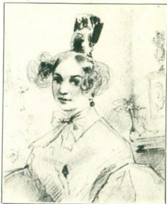
Рисунок Г. Гагарина. 1833 г.

Н о, сам признайся, то ли дело Глаза Олениной моей! Какой задумчивый в них геней И сколько детской простоты, И сколько томных выражений, И сколько неги и мечты! Потупит их с улыбкой Леля — В них скромных граций торжество; Поднимет — ангел Рафаэля Так созерцает божество. «Ее глаза». 1828 г.