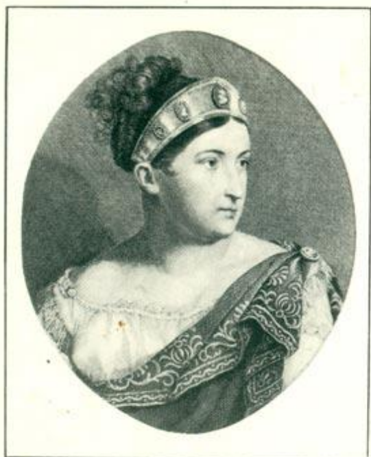
ЕКАТЕРИНА СЕМЕНОВНА СЕМЕНОВА (1786—1849)

У жель умолк волшебный глас Семеновой, сей чудной музы? Ужель навек, оставя нас, Она расторгла с Фебом узы, И славы русской луч угас! Не верю, вновь она восстанет, Ей вновь готова дань сердца, Пред нами долго не увянет Ее торжественный венец. «В кругу семей, в пирах счастливых»... 1821 г.