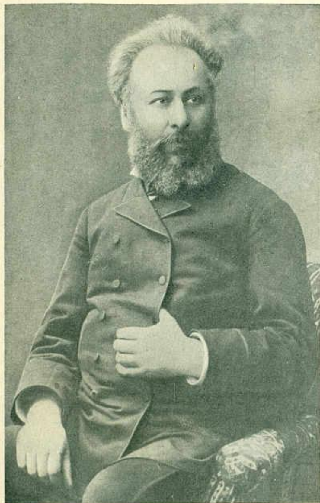
Акакий Церетели в зрелые годы