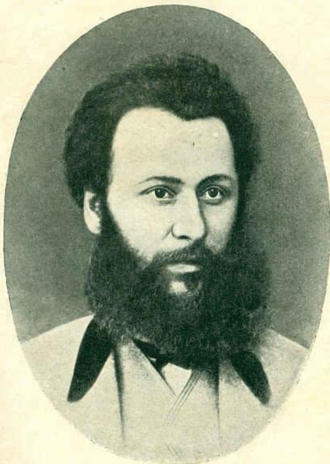
Акакий Церетели в расцвете своей творческой деятельности